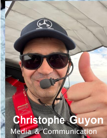
Christophe Guyon Media & Communication