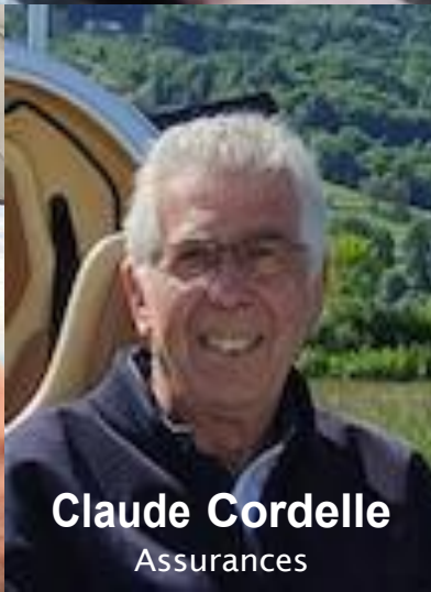
Claude Cordelle Assurances